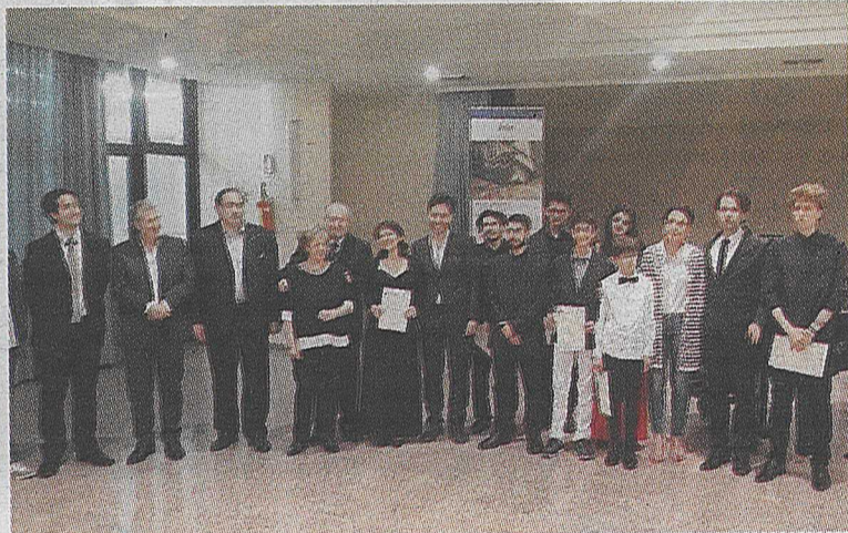
FOTO DI GRUPPO In un solo abbraccio ecco i vincitori del premio

Non ha fatto nessuna eccezione in questa edizione del Premio "Ponselle", che nell'arco di sei giorni ha vagliato e selezionato i finalisti, siano essi solisti, strumentisti o cantanti lirici, o in formazioni cameristiche e d'insieme, con l'ulteriore sezione spe-