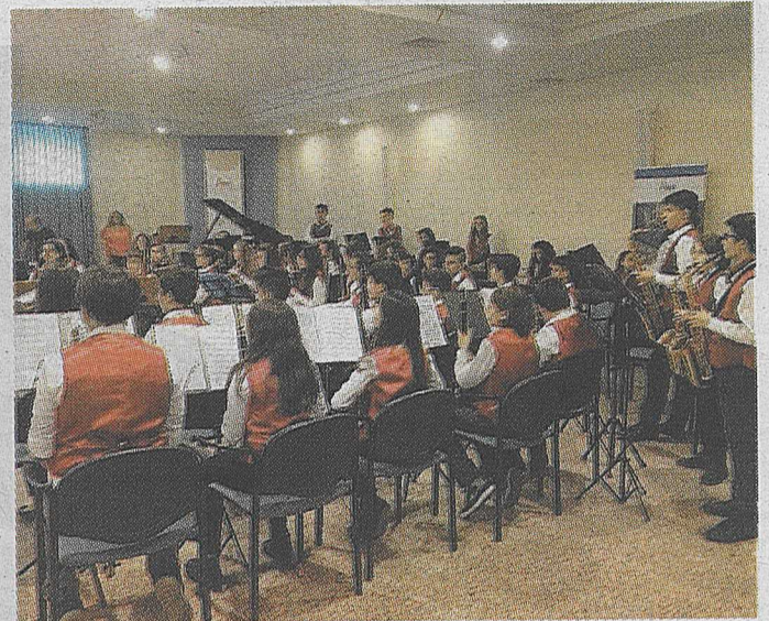
PRIMA ORCHESTRA La scuola media di Biancavilla di Catania